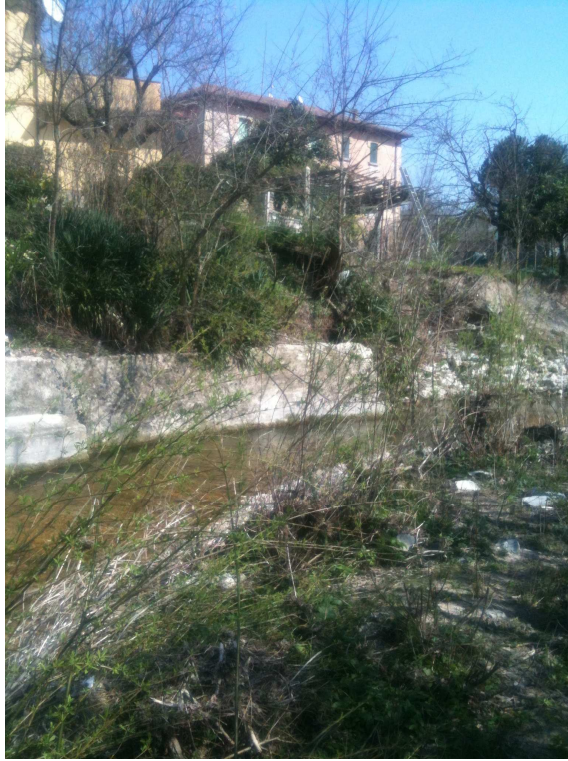
panoramica intervento (A)