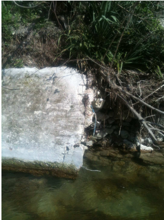
particolare muro esistente