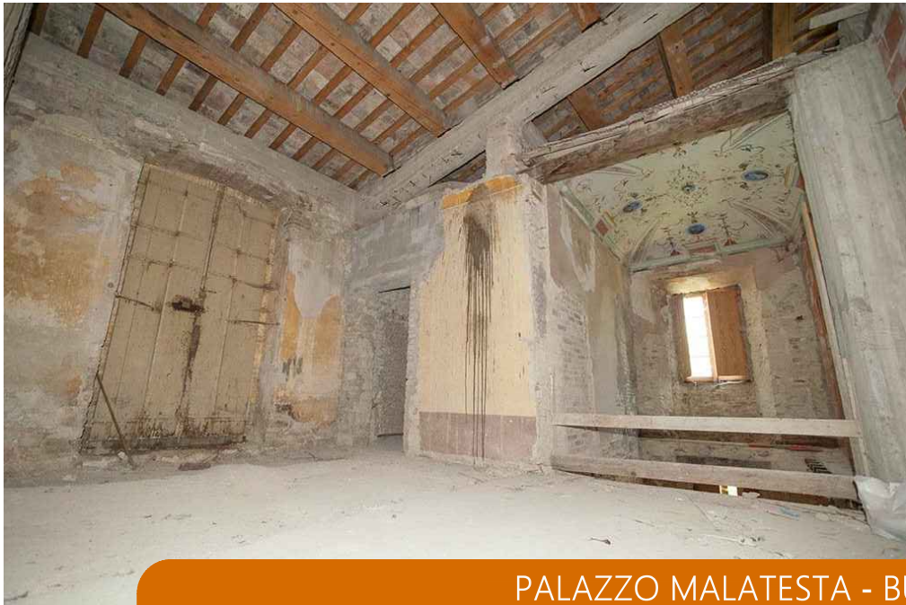
PALAZZO MALATESTA - BUZZACCARINI - GUAZZUGLI SITO NEL COMUNE DI PERGOLA (PU) INTERNO