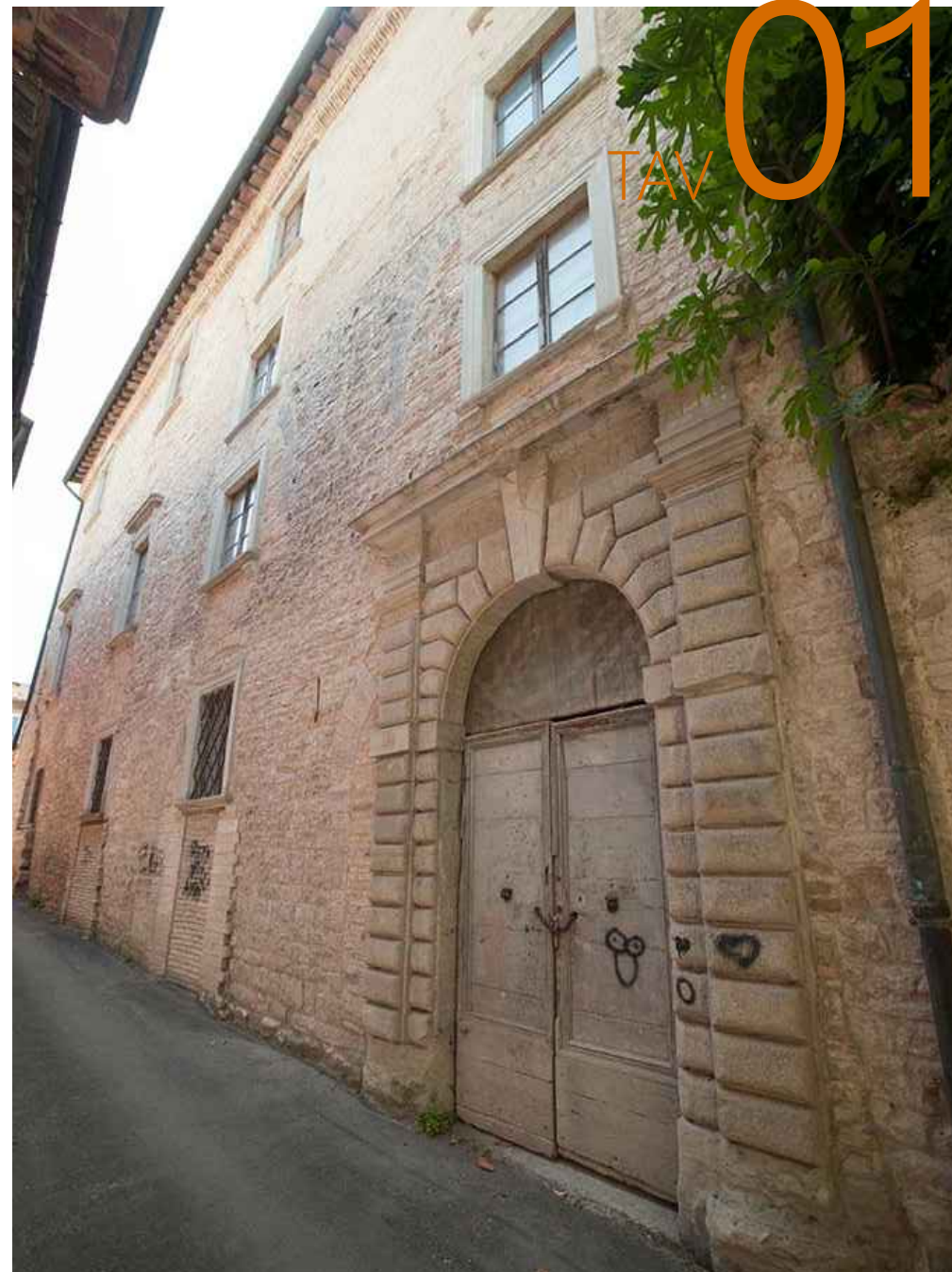
PALAZZO MALATESTA - BUZZACCARINI - GUAZZUGLI SITO NEL COMUNE DI PERGOLA (PU) ORTOFOTO - ESTERNO