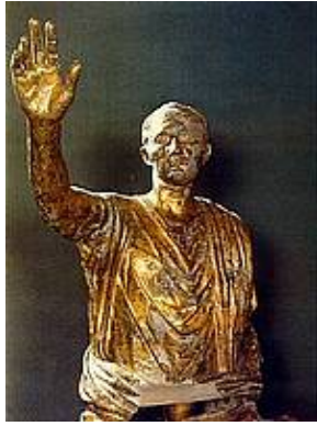
Statua di Nerone Cesare

I Bronzi Dorati da Cartoceto di Pergola rappresentano uno dei rarissimi gruppi scultorei equestri giunti fino a noi dal mondo antico. Resi famosi dalla diatriba circa il possesso fra Ancona e Pergola, fortunatamente conclusasi con un accordo che ne garantisce la pubblica fruizione, in modo sereno ed imparziale, essi furono rinvenuti casualmente in località S. Lucia di Calamello, presso Cartoceto (Pergola, PU), durante alcuni lavori agricoli. La rarità di rinvenimento di tale tipologia bronzea trova la spiegazione in vari fattori: la facilità di riutilizzo di questo metallo; la furia iconoclasta prima cristiana poi musulmana; le guerre ed i saccheggi. Tutto ciò ha reso il ritrovamento eccezionale. I Bronzi sono stati oggetto di vari restauri. Il primo (condotto tra il 1948 ed il 1959), il secondo (compiuto fra il 1975 ed il 1986) ed una revisione delle superfici (resasi necessaria nel 1993) hanno garantito sia la conservazione delle sculture, con il ritorno alla pristina condizione, sia la "codificazione" del complesso. In ogni caso, i bronzi di Cartoceto hanno un rilievo non tanto estetico–artistico (pur trattandosi di una discreta opera artigianale) ma acquistano valore dal fatto di essere una concreta testimonianza di quell'enorme diffusione di immagini monumentali a scopo propagandistico, tipica del mondo romano dalla tarda repubblica in poi.