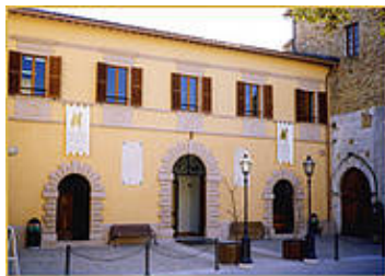
L'Entrata del museo

A Pergola, cittadina dell'entroterra marchigiano, è nato un nuovo Museo. Il quattrocentesco ex Convento di San Giacomo è stato trasformato in un moderno e protetto contenitore museale che ospita opere d'arte pittoriche, una raccolta numismatica, opere grafiche, mosaici romani, arredi lignei settecenteschi e, soprattutto, il gruppo equestre dei Bronzi Dorati di Cartoceto di Pergola.