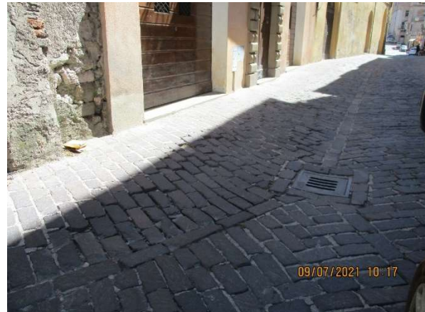
Lungo Via Raffaello