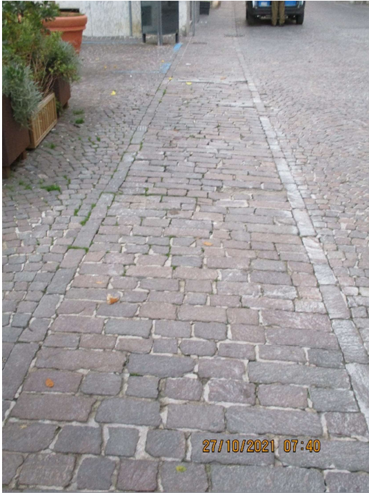
Tratto "marciapiede" tra Corso Matteotti e Piazza Ginevri