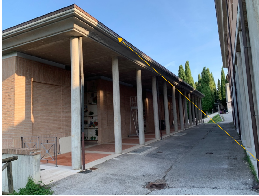
Aggancio scala a pioli